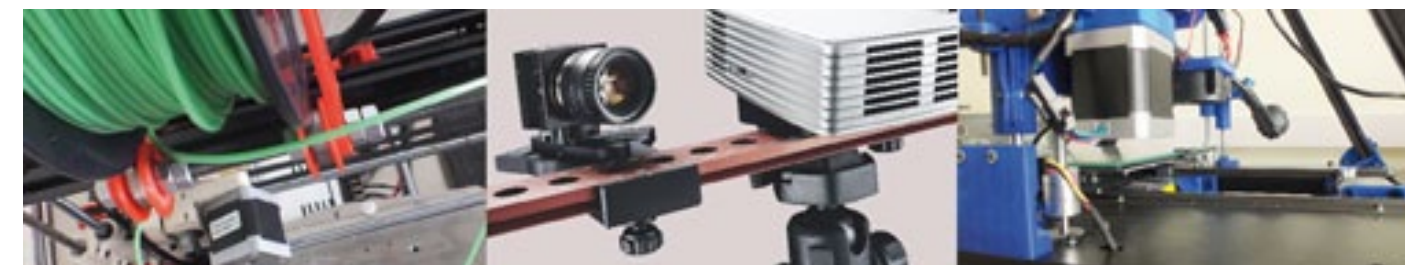
Tallers de disseny equipats amb impressores 3D i escàners 3D

Tens la possibilitat de complementar aquest grau amb un itinerari específic que permet obtenir una doble titulació